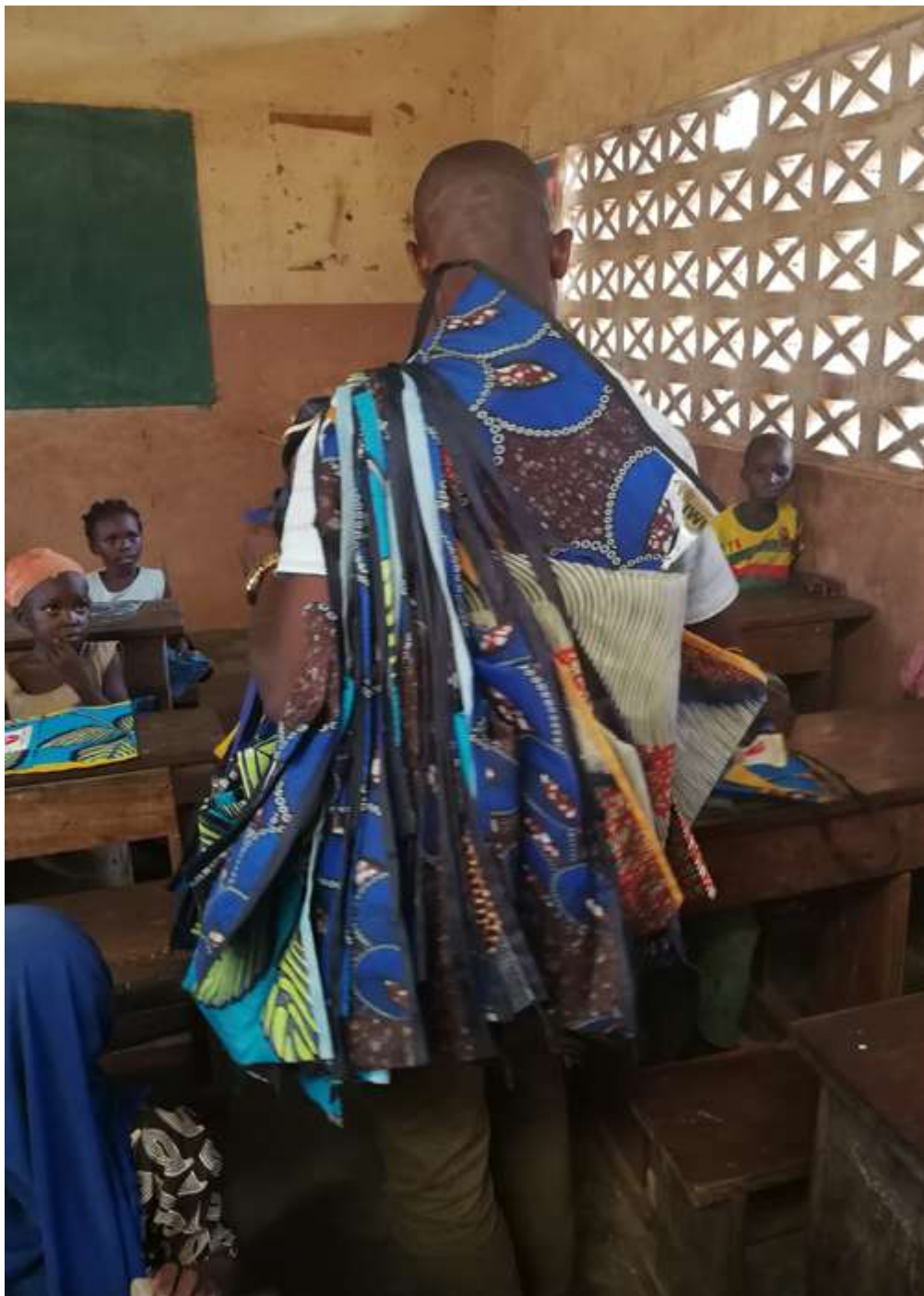
Distribution des Éco-kits Scolaires, Bénin, 2020