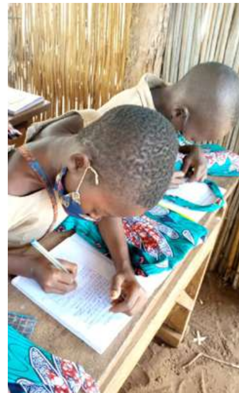
Des enfants ayant reçu leur Éco-kit Scolaire, Togo

• Des posters de sensibilisation aux gestes barrières ont été conçus et diffusés au sein même des établissements scolaires.