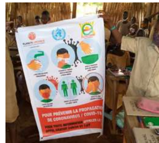
Poster de sensibilisation aux gestes barrières diffusé dans une école, Togo