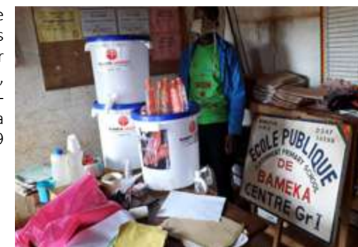
Kits Hygiène distribués dans une école primaire, Cameroun