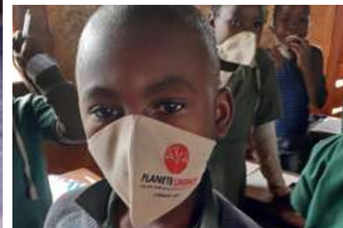
Distribution de masques dans une école primaire, Cameroun