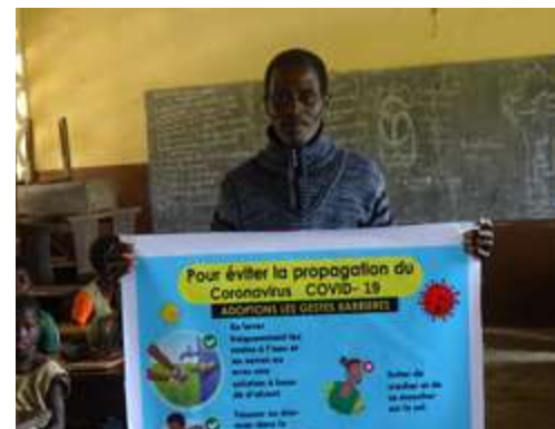
Poster de sensibilisation aux gestes barrières, école primaire publique Tchakotè, Bénin

« Je suis très content des kits distribués dans mon école. Ici, c'est une école rurale et les enfants et leurs parents ont du mal à acheter des fournitures scolaires. Ce matériel vient à point nommé et dès demain on pourra démarrer les cours. Je remercie Planète Urgence qui nous donne ces kits depuis plusieurs années. La nouveauté cette année a été matérialisée par le don des kits de lavage de mains et des posters de sensibilisation pour le COVID-19, c'est très important dans ce contexte. Merci infiniment ! »