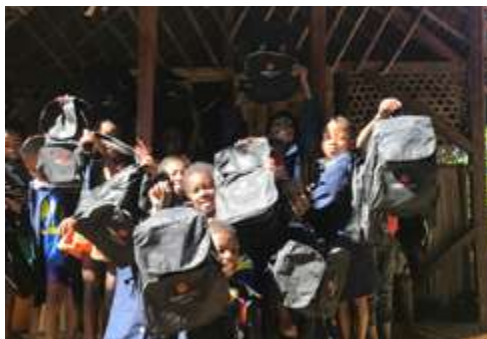
Distribution à Akiba, Madagascar

Bien que l'accès à l'éducation ait évolué dans le monde, beaucoup d'inégalités demeurent, notamment dans les pays du Sud. En cause, le manque de moyens financiers, d'équipements, de matériels scolaires et de personnels enseignants ainsi qu'une surcharge des classes.