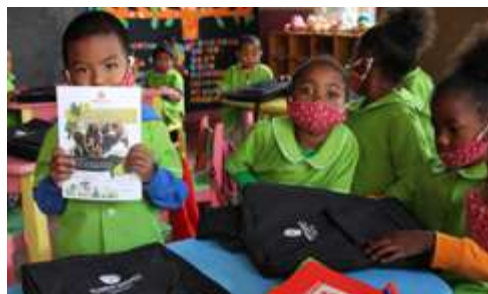
Distribution des Éco-kits Scolaires dans l'école associative «L'Île aux Enfants», Madagascar

• Chaque Éco-kit Scolaire a été fabriqué par une entreprise malgache. Les sacs sont fabriqués pour avoir une durée de vie d'un minimum de 3 ans.