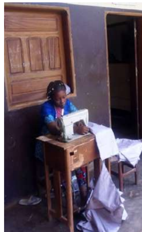
Confection des sacs des Éco-kits Scolaires par les artisans du centre des jeunes filles mères Mbang, Cameroun