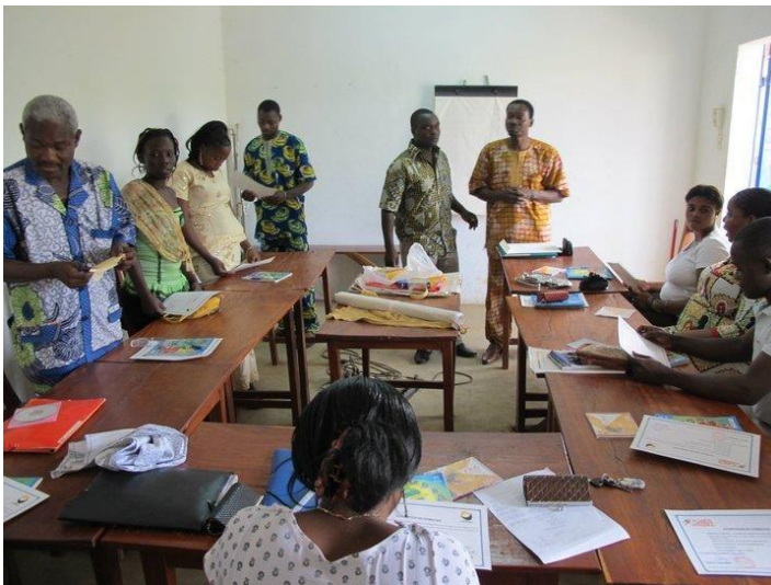
Participants à la formation

Entre Jeunes se veut être un espace de formation pluridisciplinaire et un espace de rencontre entre étudiants. Ainsi, la connaissance scientifique sera plus accessible pour tous.